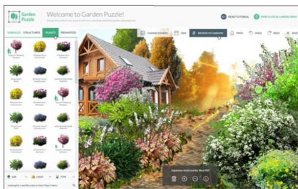
Zrzut z programu Garden Puzzle