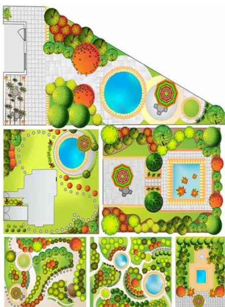
Projekt zrobiony w programie AutoCAD